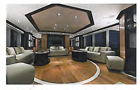
Longueur: 38,40 \ m-Largeur: 7,55 \ m-Déplacemént: n.c., -Carburant: 26 500 \ l.-Eau: n.c. \\ Motorisation: 2 x 2 400 \ ch MTU-Vitesse maxi: 24 nds-Prix: 10 millions d'euros H.T. \\ Constructeur: Majesty Yachts-Gulf-Craft (Dubai-EAU)-Importateur: Aurora/Yachts Invest (Monaco-Cannes)