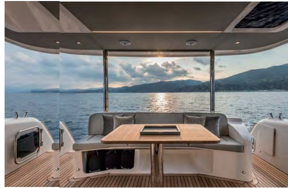
主甲板就餐区 品质感