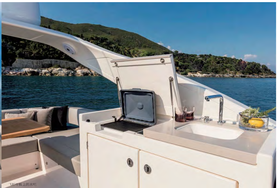
飞桥甲板上的水吧

第四间船舱是船员舱，有独立的出入口，家具设计合理，感觉船东的孩子们应该会很喜欢它，这里私密性更好，而且即使玩到很晚才回来入睡，也不会吵醒其他船舱的人。