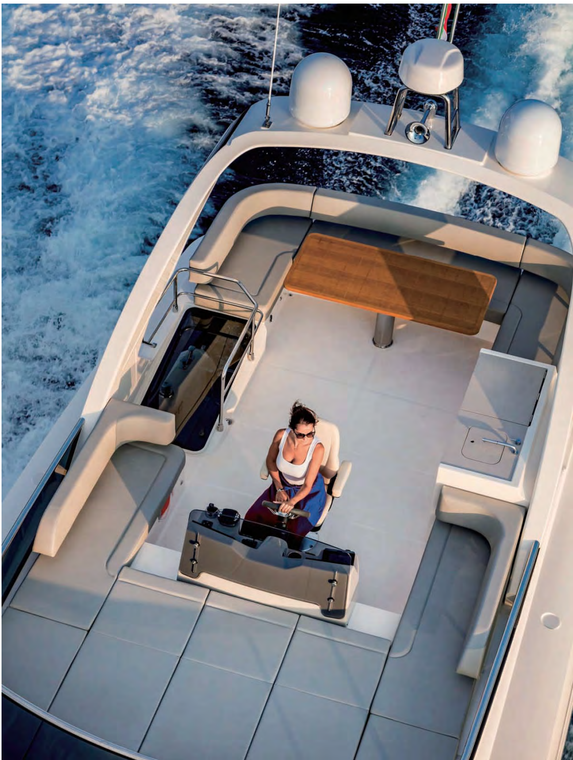
飞桥甲板上的驾驶员