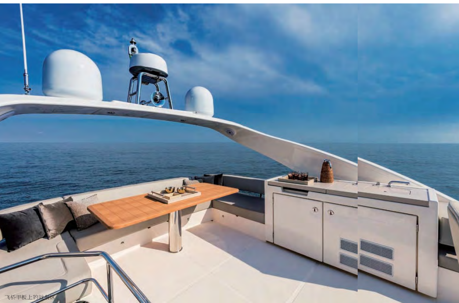
飞桥甲板上的吧台