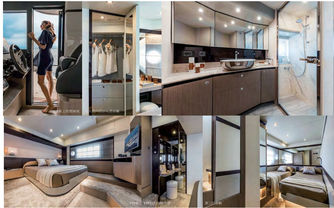
主甲板上的驾驶座