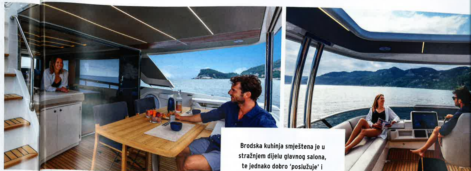
Brodsko kuhinja smještena je u stražnjem dijelu glavnog salona, te jednako dobro 'poslužuje' i blagovaonicu i kokpit zahvaljujući električno pokretanom staklu i malom šanku koji se preklapa prema krmu

koja je inače smještena u stražnjem dijelu salona. Na taj način kuhinja jednako 'poslužuje' i blagovaonicu i sam kokpit, a donošenje hrane na gornji most je maksimalno pojednostavljeno. Sam kokpit organiziran je jednostavno, iznad priveznih vitala nalaze se odlagališta za konope, tu su i krmene upravljačke komande (s desne strane) radi lakšeg privezivanja, a prema pramcu su sa svake strane smještena vratašca za bočni izlaz. Kada uđete u salon, odmah nađete na kuhinju U-oblika s lijeve strane, uz koju je kao koristan detalj ugrađen i lijep rukohvat od nehrđajućeg čelika. Već tu se primjećuje spomenuta finoća izrade interijera. U skladu s novim dizajnom vide se sjajno lakirani izrezbareni drveni stupovi koji dijele prostore, a cijelim salonom dominira besprijekoran pogled prema van zahvaljujući jako velikim (i niskim) bočnim prozorima. Kuhinju od ostatka salona dijeli pomično staklo već videno na starijim modelima, ali koje je odličan detalj u 'obitelji Absolute'. Ono što u salonu najviše privlači pažnju je zaista elegantan namještaj Minotti, koji je inače u standardu. Velika bočna stakla mogu se zatamniti električno upravljanim zavjesama, a s desne strane je veliki široki izlaz na palubu. U pramčanom dijelu glavne palube nalazi se podignuta kormilarnica koja se može potpuno izolirati od ostatka broda električno pomicanom pregradom. Most je opremljen tehnikom Garmin,